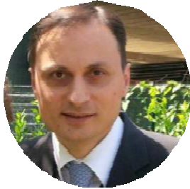
Джакомо Чикконе, президент Итальянского Евангелического Альянса

Мы просим Господа дать способность к различению, направление и мудрость церкви и глобальным движениям (таким как Евангелический Альянс).